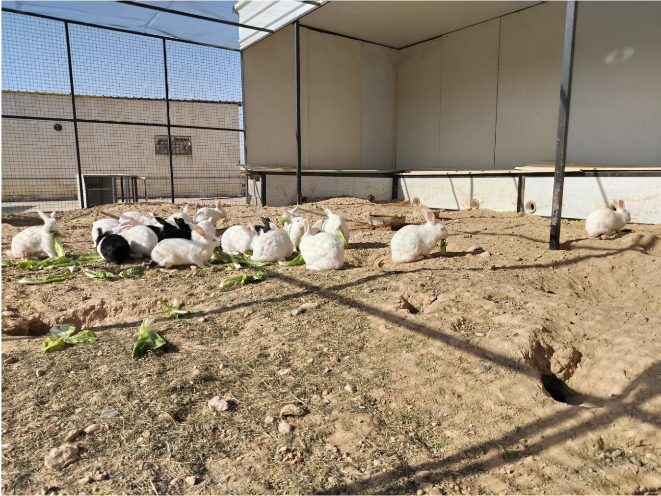
قفص تربية الارانب