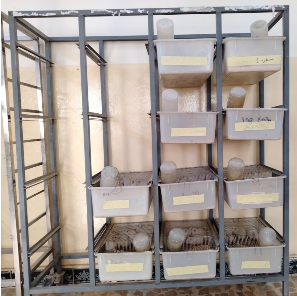
بطاريات تربية الجرذان المختبرية