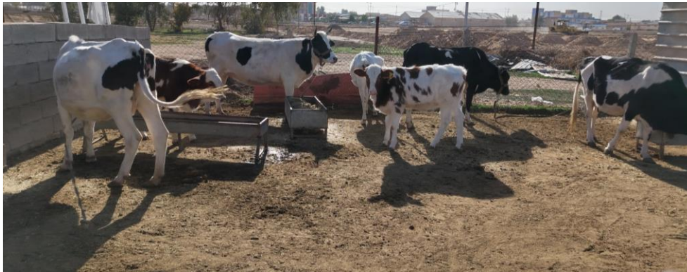
حظائر تربية الابقار (حظائر التربية المفتوحة)