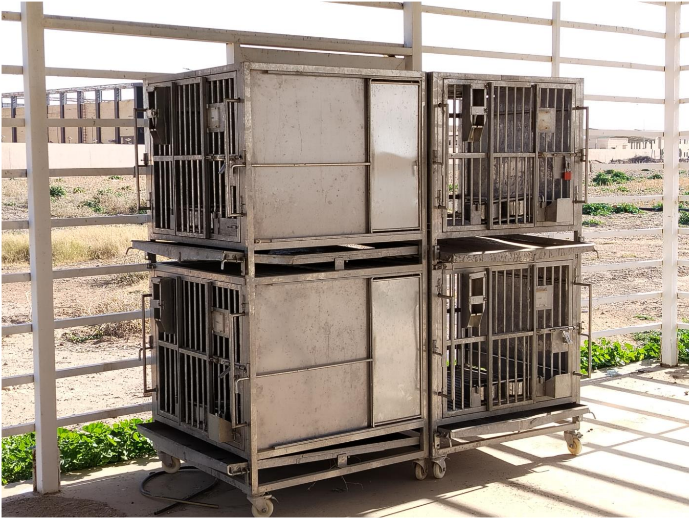
اقفاص تربية الكلاب مجهزة بكافة معدات الراحة والسلامة للحيوانات