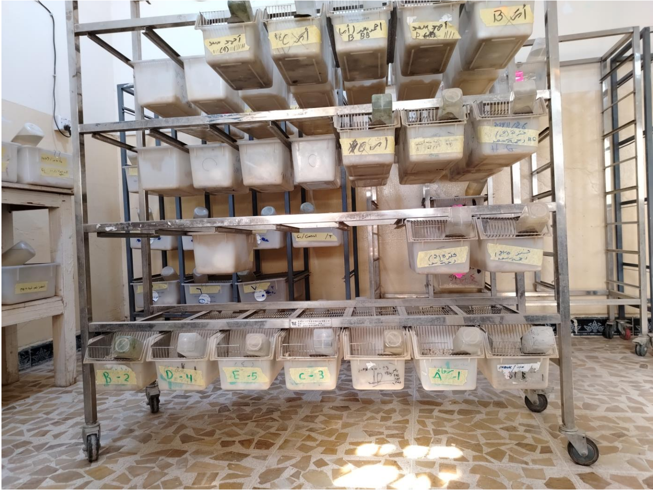
بطاريات تربية الفئران المختبرية