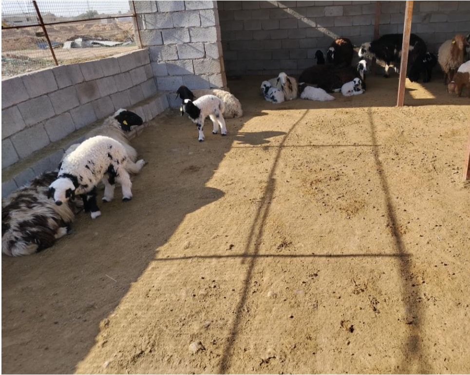
حظائر تربية الحملان (حظائر التربية المفتوحة)