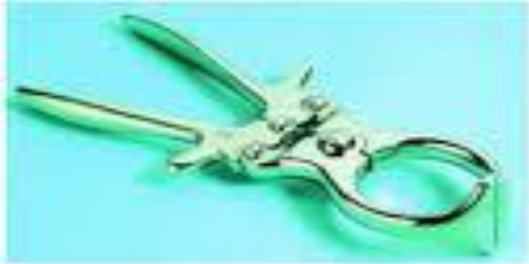
آلة برد يزر وخاصة بخصي الحملان وجداء الثعابين

تجري هذه العملية على الحملان الطويلة الذيل وذلك يؤدي إلى تحسين مظهرها وكذلك وفي الإناث تسهيل عملية تسفيدها.