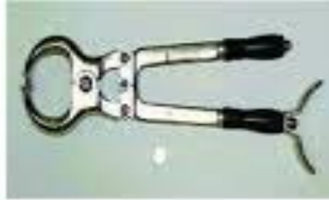
آلة برد يزر وخاصة بخصي بالعجول