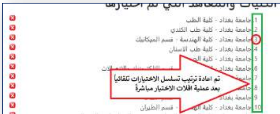
الشكل رقم (١١) إعادة ترتيب الإختيارات تلقائياً