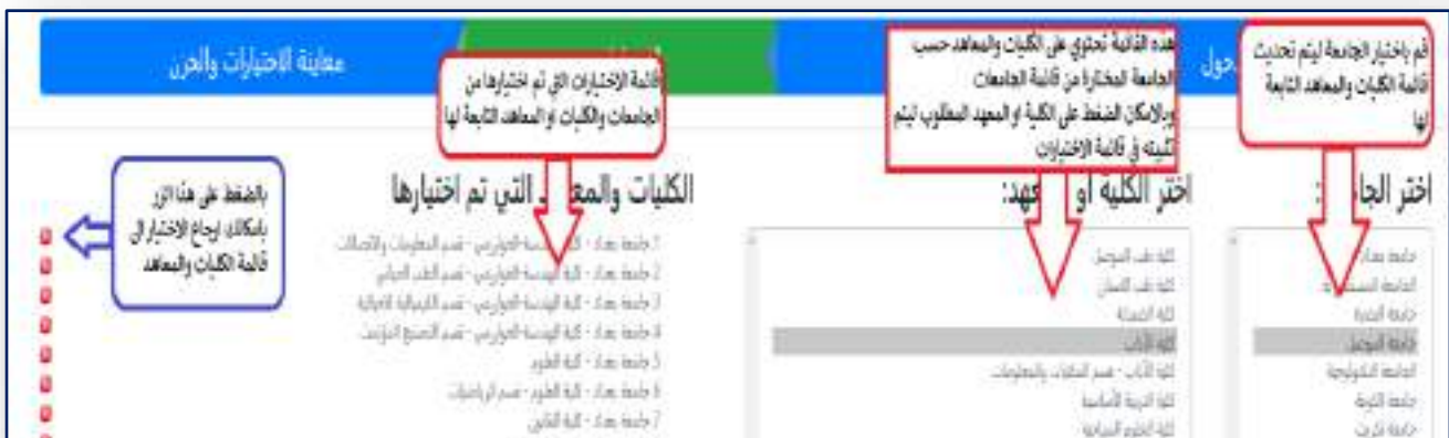
الشكل رقم (٨) قائمة باسماء الجامعات والكليات والمعاهد التي تم إختيارها من قبل الطالب

وهي أهم صفحة ، لذلك يجب عليك عزيزي الطالب الإنتباه جيداً الى كيفية تحديد إختياراتك والدقة في تثبيت إختيار صحيح على حسب الترتيب الذي ترغب به ، تم تصميم هذه الصفحة بشكل مبسط وسهل إذ تحتاج فقط إختيار اسم الجامعة التي ترغب بإختيار كلية او معهد منها لتظهر لك قائمة بجانبها تتضمن الكليات والمعاهد التابعة لهذه الجامعة وكما هو مبين بالشكل رقم (٨).