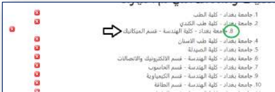
الشكل رقم (١٠) سحب الإختيار المراد تغييره الى التسلسل المطلوب