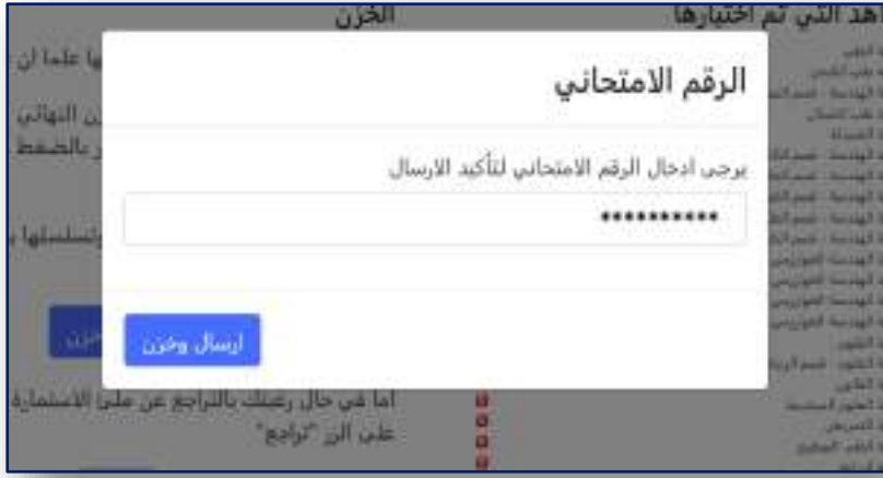
الشكل رقم (١٣) إدخال الرقم الإمتحاني لتأكيد الإرسال

وبعد كتابة الرقم الإمتحاني لتأكيد الإرسال والضغط على الزر (إرسال وخرن) سيتم إرسال خيارائك وخرنها ويتم اعتماد الإستمارة بشكل نهائي . في حال نجاح الخزن ستظهر لك الرسالة الموضحة في الشكل (١٤) لتمتلك من سحب الوصل (إستمارة التقديم الإلكتروني) الخاص بك والمثبت فيه إختيارائك المخزونة.