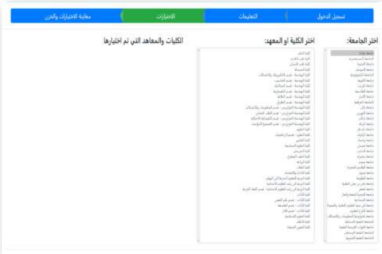
الشكل رقم (٧) الصفحة الخاصة بتحديد الإختيارات

وبعد الضغط على زر (الإختيارات) من شريط مراحل الملء سوف تظهر الصفحة الخاصة بتحديد الإختيارات كما في الشكل رقم (٧).