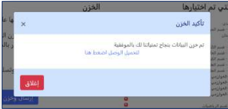
الشكل رقم (١٤) تحميل إستمارة التقديم الإلكتروني

وبعد كتابة الرقم الإمتحاني لتأكيد الإرسال والضغط على الزر (إرسال وخرن) سيتم إرسال خيارائك وخرنها ويتم اعتماد الإستمارة بشكل نهائي . في حال نجاح الخزن ستظهر لك الرسالة الموضحة في الشكل (١٤) لتمتلك من سحب الوصل (إستمارة التقديم الإلكتروني) الخاص بك والمثبت فيه إختيارائك المخزونة.