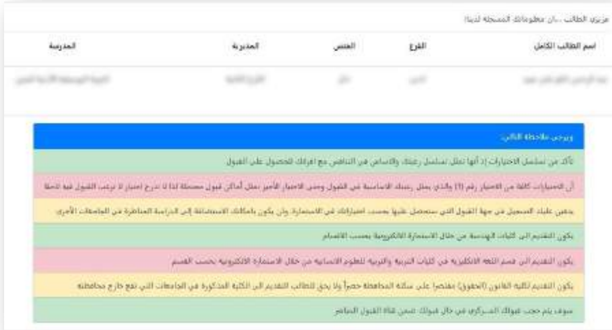
الشكل رقم (٣) معلومات الطالب والتعليمات العامة للتقديم

إذا تمت عملية إدخال المعلومات الخاصة بتسجيل الدخول بنجاح سوف تظهر الصفحة الخاصة بمعلومات الطالب والتعليمات العامة للتقديم كما في الشكل رقم (٣).