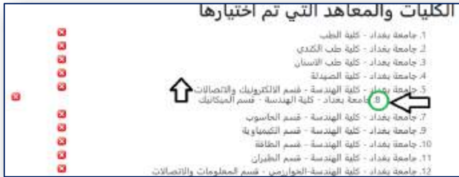
الشكل رقم (٩) تغيير تسلسل الإختيار