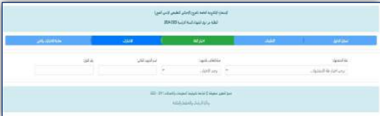
الشكل رقم (٦) إختيار الفنة لذوي الشهداء

ملاحظة: إذا كان الطالب من ذوي الشهداء فيجب عليه إختيار الفنة الخاصة به وكما هو مبين في الشكل رقم (٦).