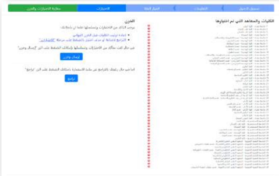
الشكل رقم (١٢) معاينة الإختيارات والخرن

تم إنشاء الصفحة الموضحة في الشكل رقم (١٢) أعلاه لمعاينة الإختيارات التي ملأها الطالب في الخطوة السابقة قبل الإرسال والخرن النهائي لتسهيل الإجراءات على الطالب وإعطاء فرصة أخرى لتعديل خياراته او تعديلها.