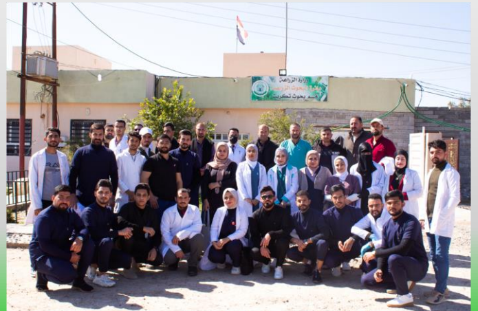
التعاون المشترك بين كلية الطب البيطري وباقي مؤسسات الدولة