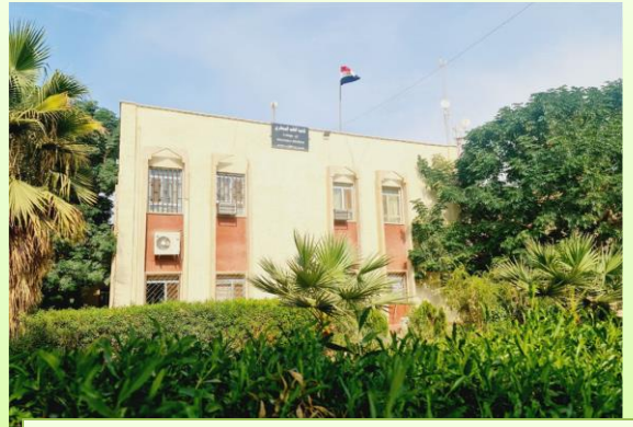
عمادة كلية الطب البيطري