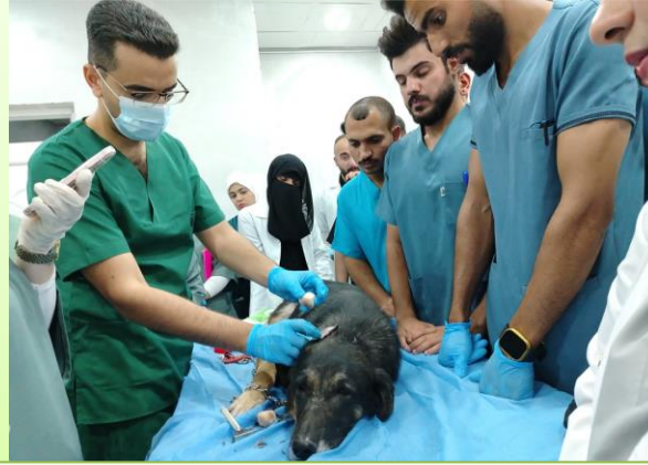
مشاهدة الطلبة للحالات البيطرية الواردة للكلية