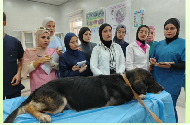
معاينة الطلبة للحالات الواردة الى المستشفى البيطري الجامعي