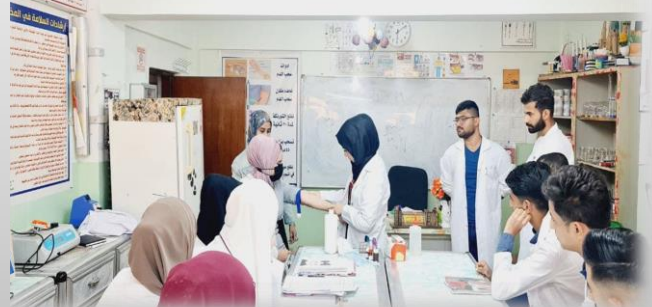
مختبر الكيمياء العامة