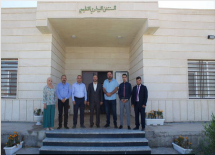
فرع الطب الباطني والجراحة والتوليد

يُعنى بمتابعة علم الأمراض البيطرية والوقوف على مختلف التغيرات المرضية التي تطرأ على جسم الحيوان ومنها الأمراض التي قد تنتقل إلى الإنسان، وأمراض الدواجن وأمراض الأسماك ومادة التشريح المرضي والطب العدلي ومادة السلوك المهني لطلبة