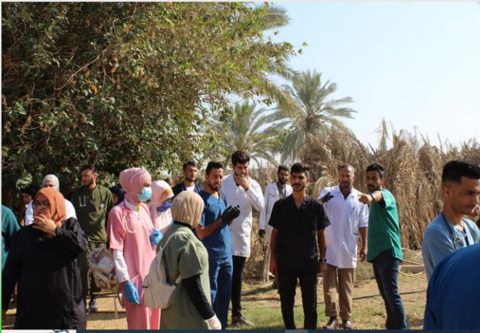
التعاون المشترك بين كلية الطب البيطري والمناطق المجاورة