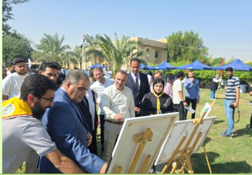
مشركة الطلبة في فعالية الرسم الحر

تشارك كلية الطب البيطري بأساتيذها وطلبتها في كافة النشاطات اللاصفية المقامة في الجامعة ، حيث تعمل الأنشطة على تعزيز التواصل وترسيخ قيم المجتمع الجامعي في ذهن الطالب ، ومن جهة أخرى تعمل على صقل مواهب الطلبة وتعزيز مهاراتهم ومواهبهم.