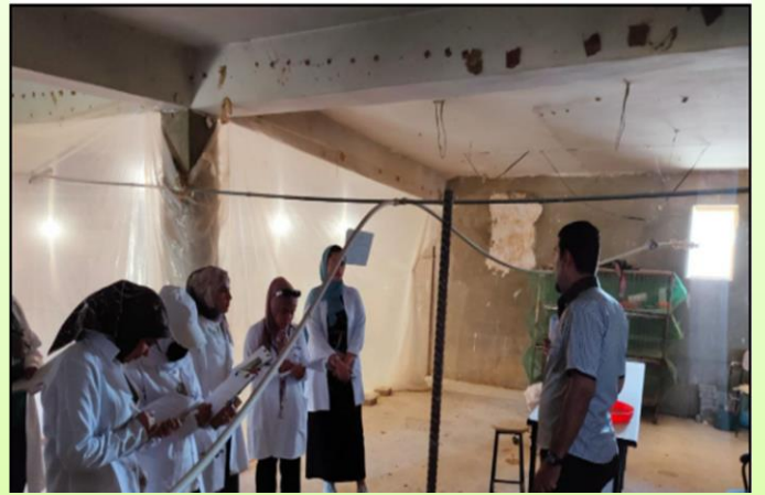
زيارة ميدانية لطلبة المرحلة الاولى الى حقول كلية الزراعة