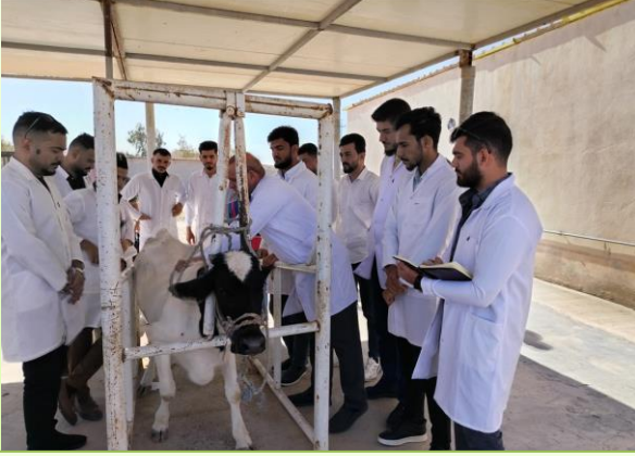
تفاعل الطلبة بشكل عملي داخل حقول الكلية