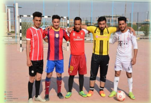
مشركة الطلبة في دوري الكوة الخماسي