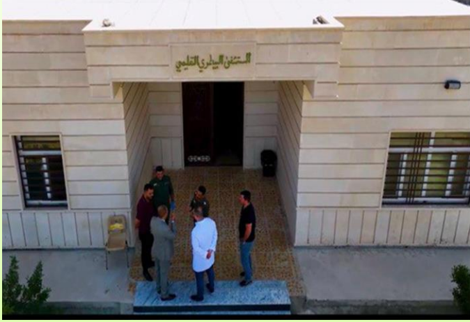
المستشفى البيطري التعليمي الجامعي في كليتنا