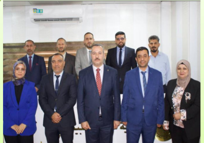
رئيس واعضاء مجلس الكلية