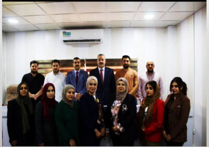
فوق الاحياء المجهرية

يُعنى بتهيئة كادر متخصص في مجال الطب البيطري لتشخيص أهم الأمراض البيطرية التي تصيب الحيوانات وخاصة الأمراض الشائعة في العواق، وكذلك معني برفد الطلبة بأساسيات علم الأحياء المجهرية