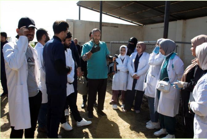
زيارة ميدانية لطلبة المرحلة الرابعة