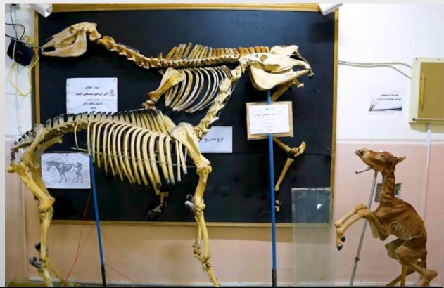
مختبر فوع التشريح