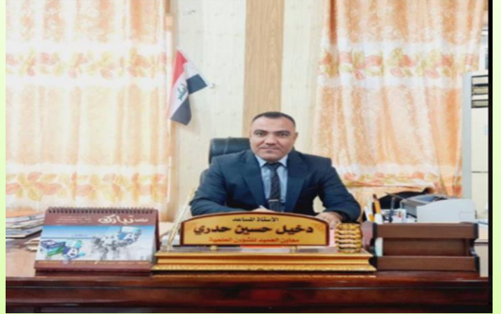
معاون العميد للشؤون العلمية