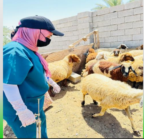
الحملة التطوعية التعاونية لكلية الطب البيطرى - قرية المحزم