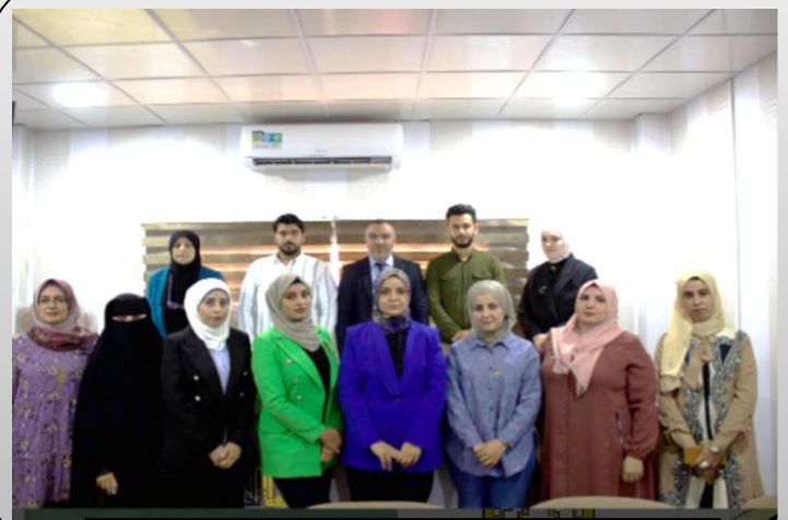
فروع الفلسفة والأدوية والكيمياء الحياتية