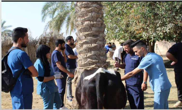
التعاون المشترك بين كلية الطب البيطري والمناطق المجاورة