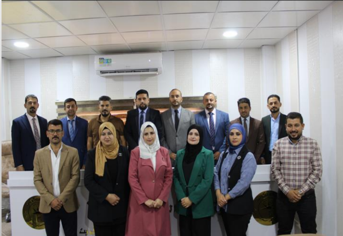
فروع الصحة العامة

يعد فرع الفلسفة والأدوية والكيمياء أحد الفروع المهمة في كلية الطب البيطري للوحدات ما قبل السوربية والعليا ، إذ يُعنى بتدريس مادة الفلسفة (علم وظائف الأعضاء) والكيمياء الحياتية. كما يُنيط بالفروع تدريس مادة الأدوية وكيفية وصف