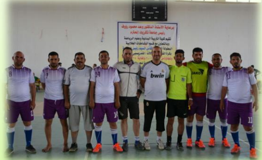
مشركة الاساتيد في دوري الكوة الخماسي للصالات