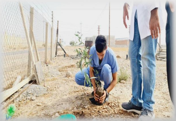
مشركة الطلاب فى خدمة المجتمع