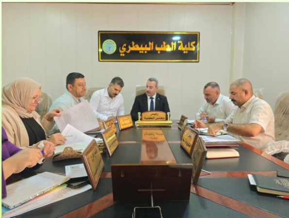
جلسة مجلس الكلية الاولى في العام الدراسي 2024-2025