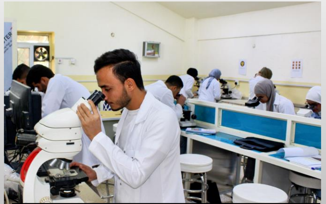
مختبر فوع الاحياء المجهرية